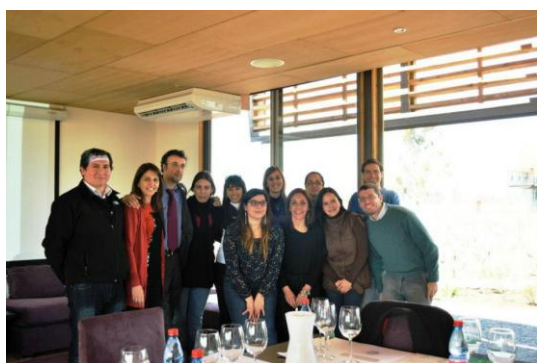
El equipo de CapacitaRSE en Chile, los coordinadores de las Redes Pacto Global de Chile y Paraguay y algunos de los