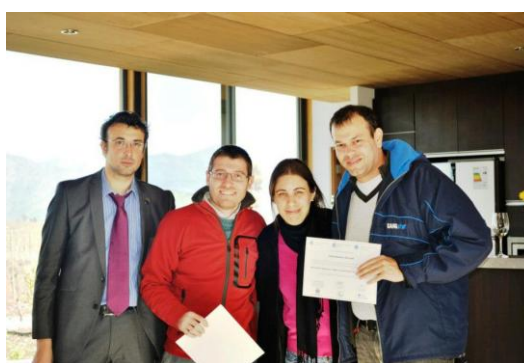
Algunos egresados del Diplomado con sus Diplomas en mano