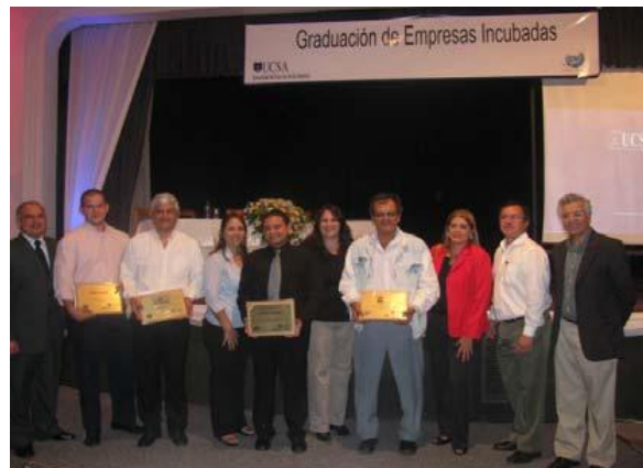
Acto de Graduación de Empresas